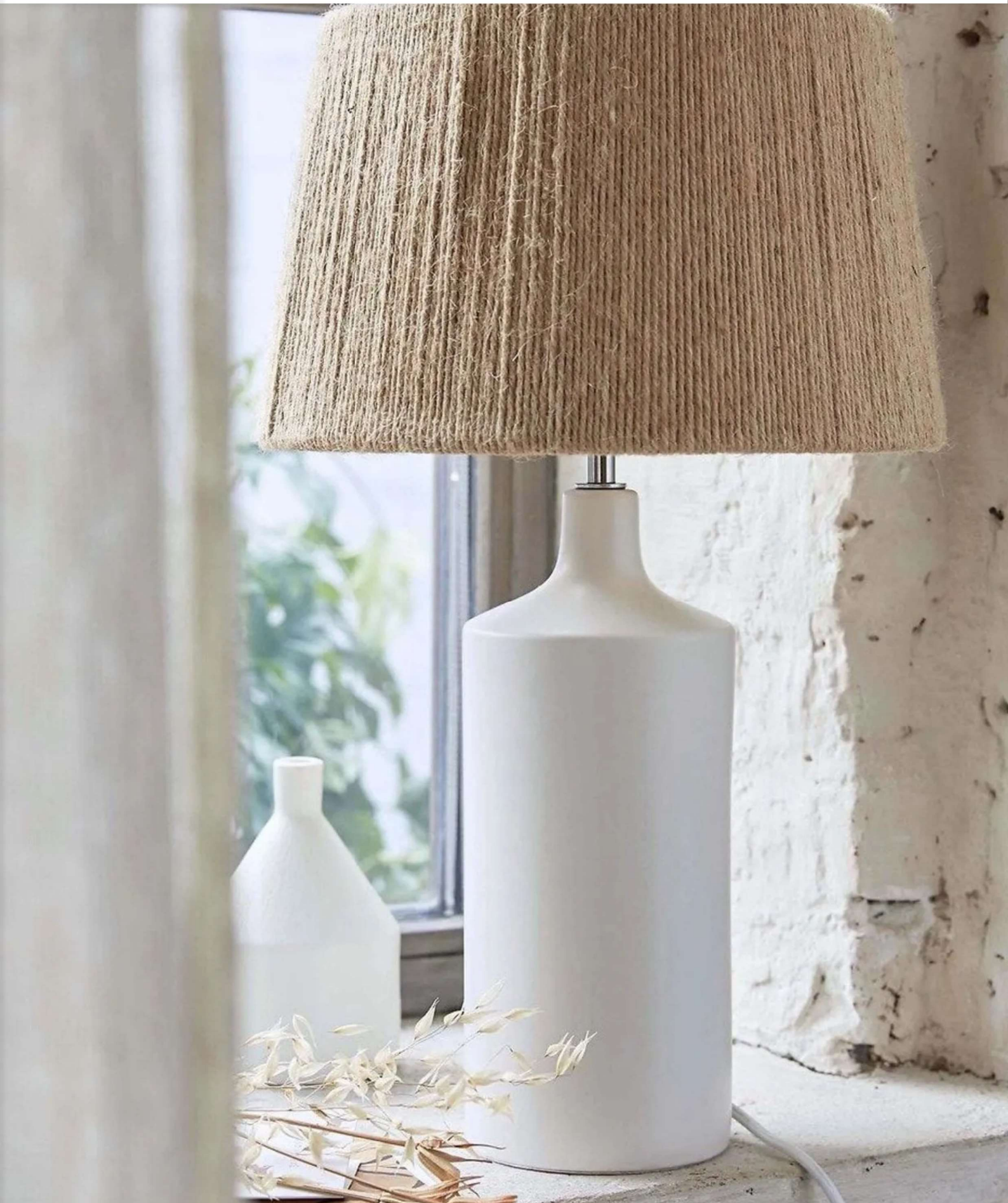
Sur un abat-jour, le chanvre offre un éclairage doux et un univers authentique (en photo : lampe en céramique et chanvre Yoru, La Redoute Intérieurs). La Redoute Intérieurs