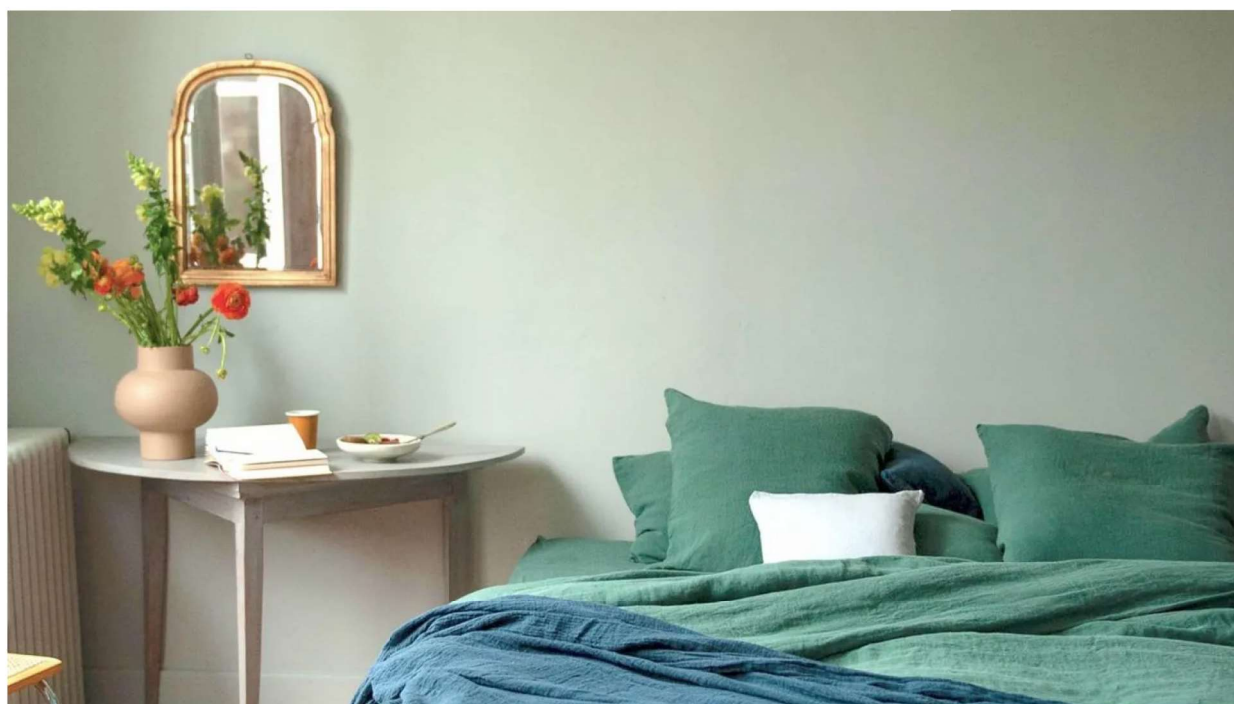
Après le lin, le chanvre nouvelle matière star de nos intérieurs ? Couleur Chanvre

Au-delà d'une tendance ponctuelle, le chanvre a toutes les raisons de devenir un incontournable, que ce soit dans le domaine du linge de maison, de la décoration, voire au-delà. Il se distingue par sa nature à la fois naturelle et durable, offrant des qualités uniques qui garantissent confort et douceur. En ce qui concerne le style, la fibre s'épanouit dans une magnifique palette de couleurs. Dans un monde où les ressources s'épuisent, le chanvre est